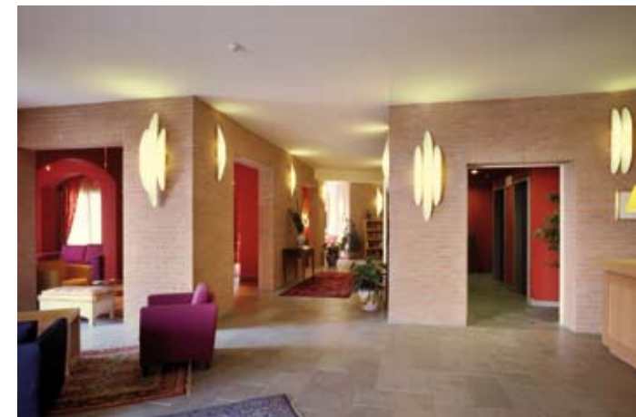
Hotel San Gimignano San Gimignano, Siena CLASSICO ROSATO